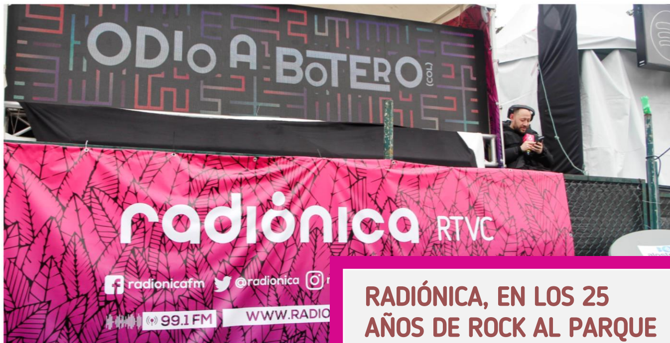
Rock al Parque